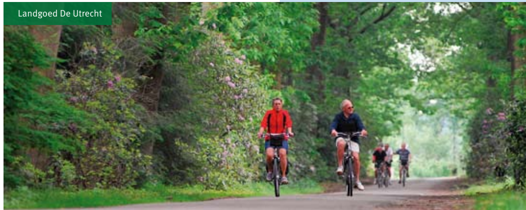
Landgoed De Utrecht

Kp 27 – kp 98 Op splitsing bij kp 27 LA ri kp 28 en Netersel, Kapeldijk. Na 600 meter bij kp 28 RA ri kp 69 en kp 98 . Fietspad langs onverharde Liedsdijk door bos volgen. Bij kp 69 RD ri kp 98 . Fietspad over heide en langs vennen ( kijkpunt C ) volgen. Op splitsing bij kp 98 RD ri kp 99 * .