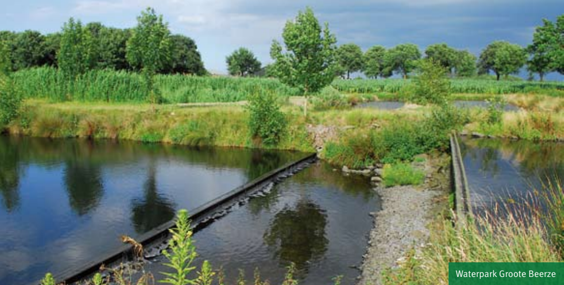
Waterpark Grote Beerze