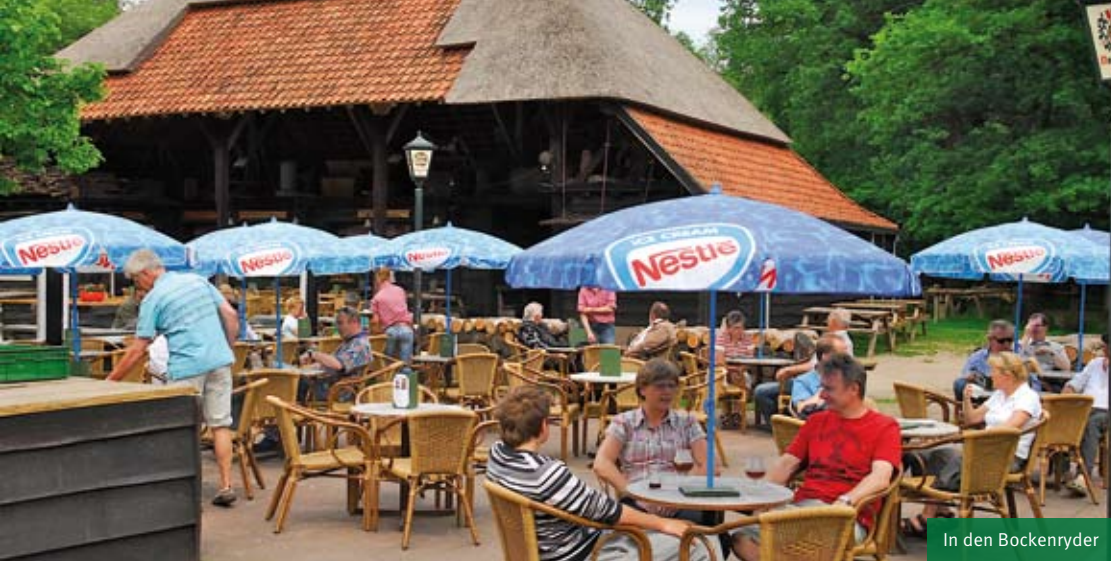
In den Bockenryder