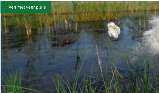
Ven met veenpluis

Tot 1850 bestonden grote delen van de Kempen alleen uit heide. Totdat in de tweede helft van de 19e eeuw grote stukken land werden verkocht voor de houtproductie. Het gebied tussen Esbeek en Lage Mierde kwam in 1899 in handen van Levensverzekeringsmaatschappij De Utrecht. De heide werd ontwaterd, omgeploegd en beplant met naaldbomen. Gelukkig wisten sommige gebiedjes de ontginningsdans te ontspringen, zoals een stukje van het Reuseldal. Op de meeste plaatsen is de Reusel een rechte beek met weinig stroming, maar binnen de grenzen van Landgoed De Utrecht is het oorspronkelijke, sterk kronkelende verloop opmerkelijk goed bewaard gebleven. Ook het oude beekbos langs de Reusel verkeert hier nog in de oude staat.